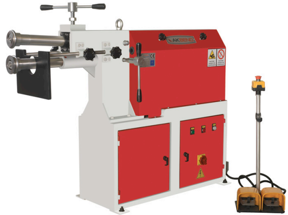
AKM- 250 & 400 Motorised (with 3 Sets Rolls)