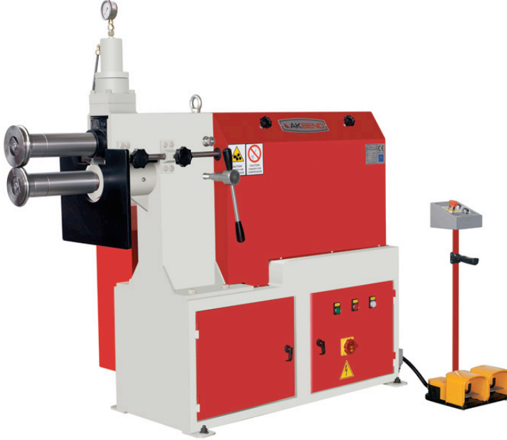
AKM-400 Hydraulic (with 3 Sets Rolls)